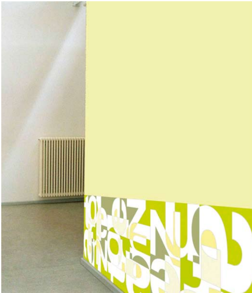
Montage - Tapetenmusterstreifen im Raum