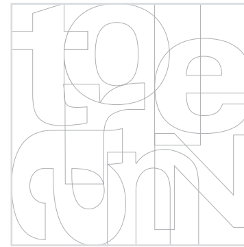
Grundstruktur des Tapetenmusters ohne Farbgebung

Toleranz, ein sehr häufig benutztes Wort. Durch plakative Bekenntnisse abgenutzt. Die Definition im Wahrig Fremdwörterlexikon: 1 (unz.) tolerantes Wesen, Duldsamkeit; Ggs. Intoleranz 2 (zählb.) zulässige Abweichung von Maßen [ < lat. tolerantia „das Ertragen, das Erdulden, Geduld, Duldsamkeit“ ]